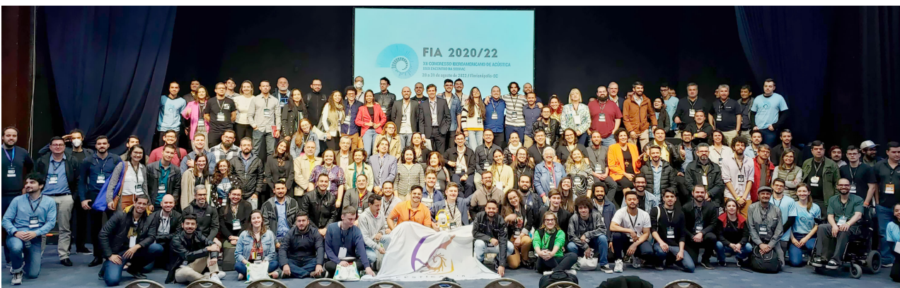
(i) Participantes FIA 2020/22 en la Ceremonia de Clausura.