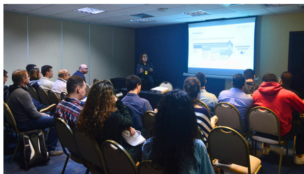
(b) Registro de minicurso impartido.