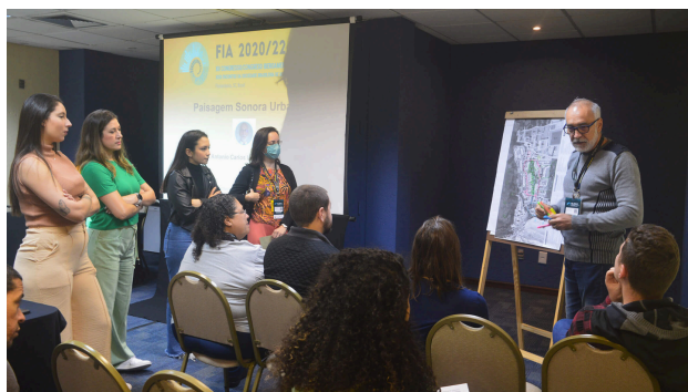
(a) Registro de minicurso impartido.

Finalmente, se llevó a cabo la Ceremonia de Clausura del congreso (Figuras 3 (i) y 4), y la despedida del 12º Congreso Iberoamericano de Acústica fue realizada con éxtasis y satisfacción por todo el comité organizador y los demás participantes del evento, quienes contribuyeron a que los cuatro días estuvieran llenos de conversaciones, debates y estudio, y que el FIA 2020/22 concluyera con gran éxito y expectativa para el próximo evento.