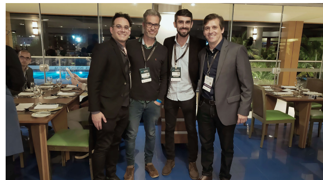
(h) Participantes y organizadores en la Cena de Confraternización.