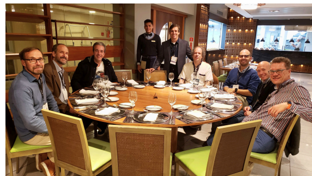
(f) Participantes y organizadores en la Cena de Confraternización.