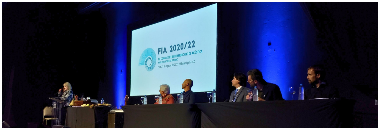
Figura 2: Comité organizador en la ceremonia de apertura.