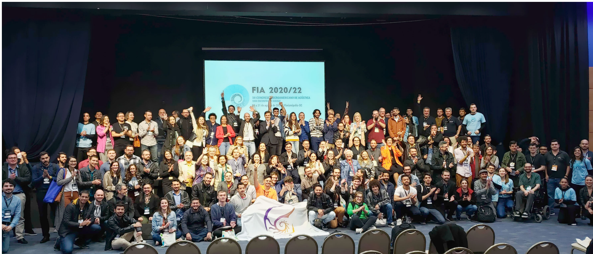
Figura 4: Participantes FIA 2020/22 en la Ceremonia de Clausura.