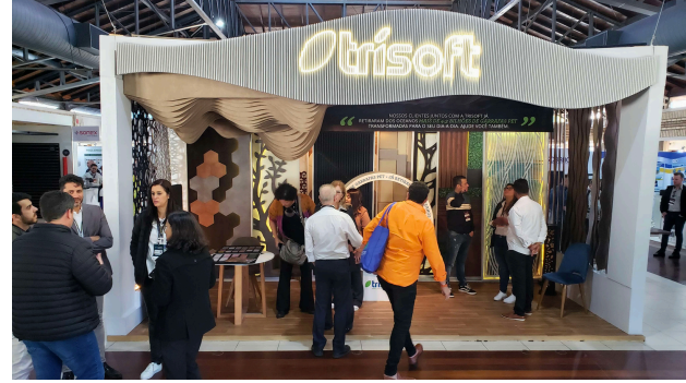
(d) Participantes en la Feria de Expositores.