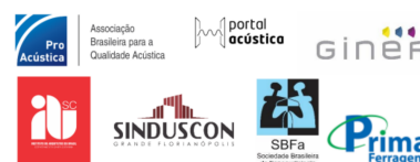
Figura 5: Empresas e instituciones patrocinadoras y de apoyo del FIA2020/22.