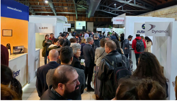
(c) Participantes en el cóctel de apertura.