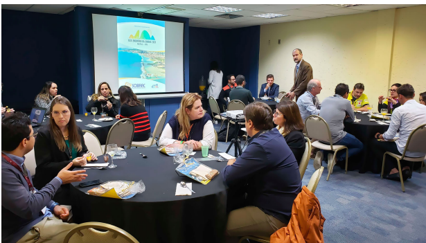
(g) Preparativos para el XXX Encuentro Sobrac en Natal, RN (2023).