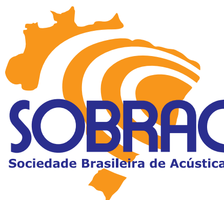
Figura 1: Logo oficial da Sociedade Brasileira de Acústica – Sobrac.